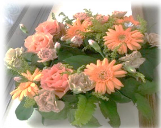
（地域の方が生けてくださった事務室前の生け花）