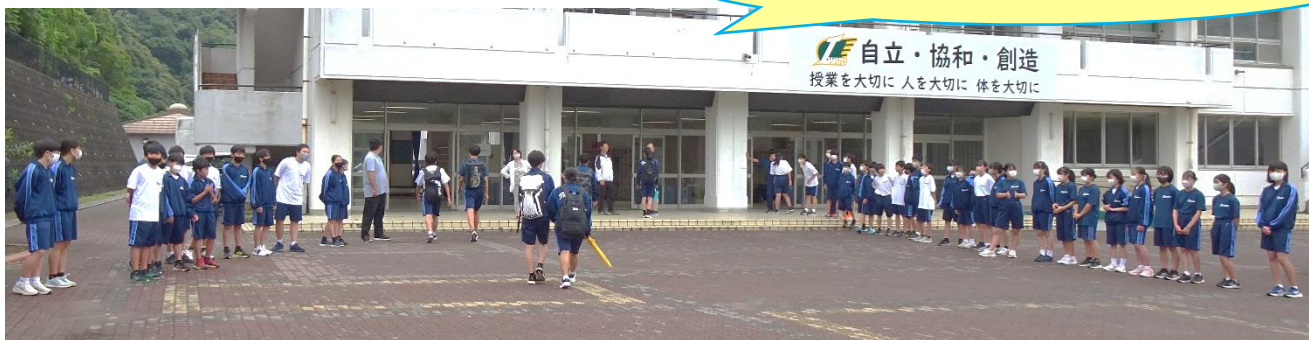
あいさつ運動をしている様子(6月23日朝 1年生)

生徒会では『朝のあいさつ運動』に取り組んでいます。本年度2回目となるあいさつ運動が、6月21日(水)～23日(金)の生徒が登校する時間帯に生徒用昇降口で実施されました。生徒会執行部と各学年の学級委員、そして各学年有志のメンバーが、登校する生徒にあいさつの声掛けをすることで、あいさつの習慣が身につくと同時に、お互いに気持ちよく朝の爽やかなスタートにつなげています。